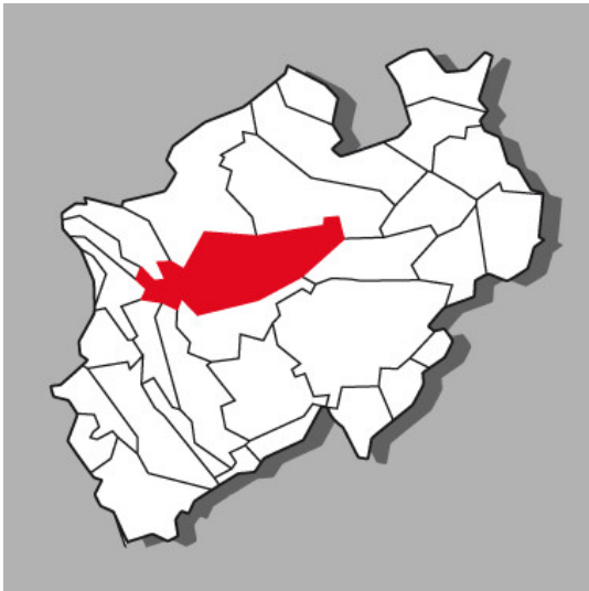
Lage der Kulturlandschaft Ruhrgebiet in Nordrhein-Westfalen