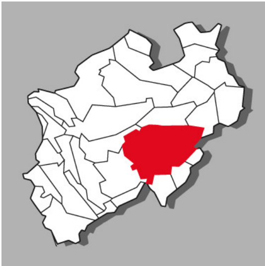
Lage der Kulturlandschaft Sauerland in Nordrhein-Westfalen