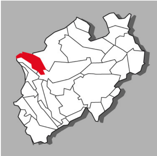
Lage der Kulturlandschaft Unterer Niederrhein in Nordrhein-Westfalen