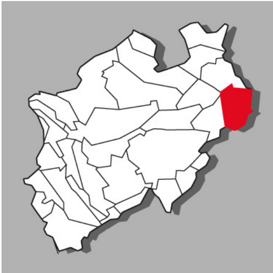
Lage der Kulturlandschaft Weserbergland - Höxter in Nordrhein-Westfalen