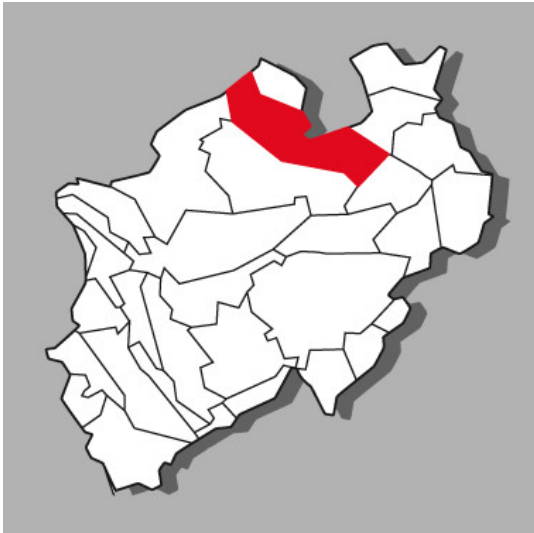
Lage der Kulturlandschaft Ostmünsterland in Nordrhein-Westfalen