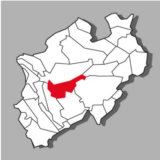
Lage der Kulturlandschaft Niederbergisch-Märkisches Land in Nordrhein-Westfalen