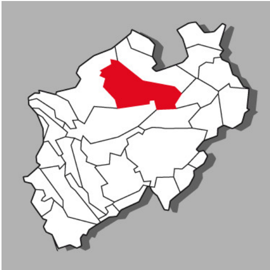
Lage der Kulturlandschaft Kernmünsterland in Nordrhein-Westfalen