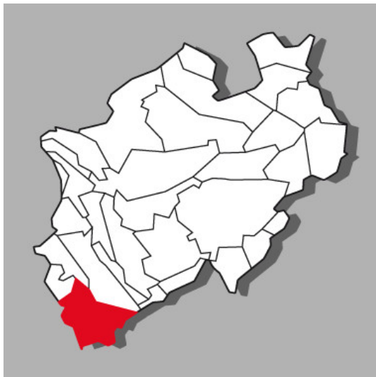
Lage der Kulturlandschaft Eifel in Nordrhein-Westfalen