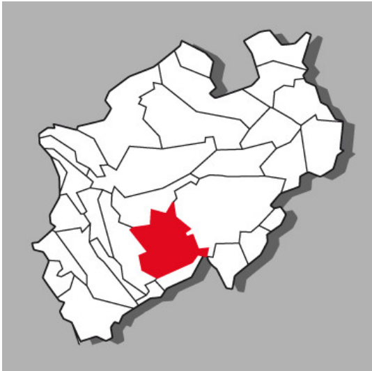
Lage der Kulturlandschaft Bergisches Land in Nordrhein-Westfalen