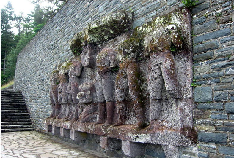
1938 geschaffenes Sportrelief an den Sportanlagen des NS-Schulungsheims "Ordensburg Vogelsang" bei Schleiden-Gemünd (2015).

Schlagwörter: Burg , Schule (Institution) , Kaserne , Truppenübungsplatz , Ortswüstung , Dokumentationseinrichtung (Gebäude) Fachsicht(en): Kulturlandschaftspflege , Landeskunde