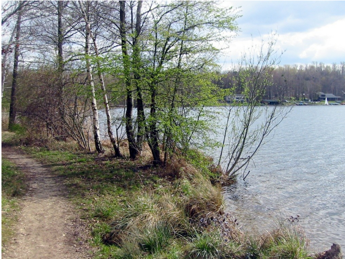
Uferbereich des Liblarer Sees (2010).