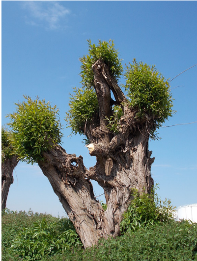
Eine nach dem Pflegeschnitt austreibende Kopfb weide vor stahlblauem Himmel, am Gewerbegebiet Königskamp bei Jülich (2013)