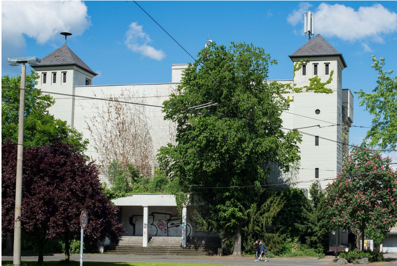
Hochbunker in Dottendorf, Quiriniusplatz (2013)