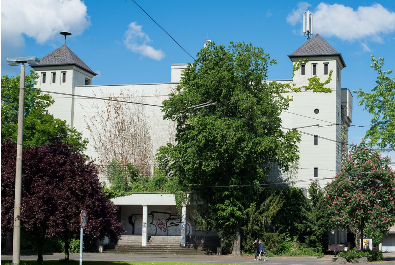
Hochbunker in Dottendorf, Quiriniusplatz (2013)