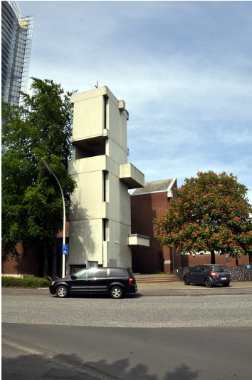
Katholische Kirche Sankt Winfried in Bonn (2016)