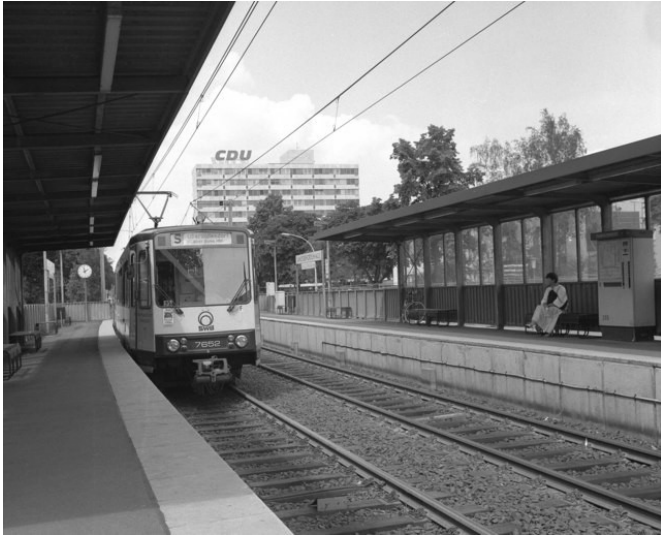
Eine Station der Bonner Stadtbahn an der Friedrich-Ebert-Allee (1986), im Hintergrund die damalige Bundesgeschäftsstelle der CDU, das Konrad-Adenauer-Haus.

Fachsicht(en): Kulturlandschaftspflege, Denkmalpflege