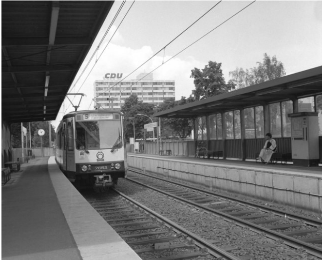
Eine Station der Bonner Stadtbahn an der Friedrich-Ebert-Allee (1986), im Hintergrund die damalige Bundesgeschäftsstelle der CDU, das Konrad-Adenauer-Haus.

Fachsicht(en): Kulturlandschaftspflege, Denkmalpflege