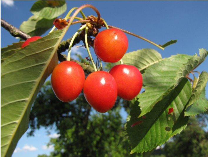
Tilgeners Frühe Herzkirsche (2011)