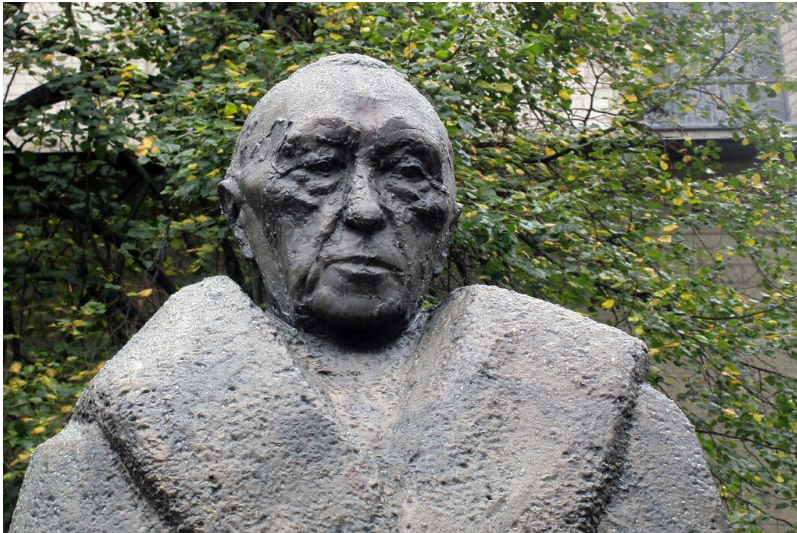
Portät Konrad Adenauers in Form der Bronzeplastik des ihm gewidmeten Denkmals an Sankt Aposteln in Köln (2020).

Fachsicht(en): Kulturlandschaftspflege, Landeskunde