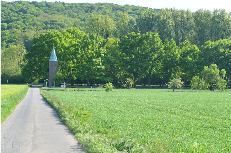
Zufahrt zum Soldatenfriedhof bei Sinzig-Bad Bodendorf (2014)