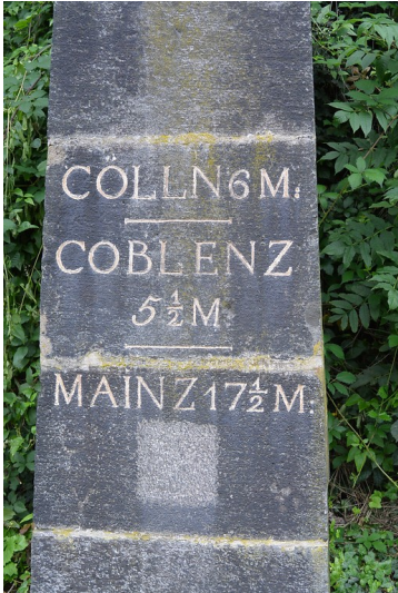
Teilansicht des preußischen Meilensteins zwischen Remagen und Unkelbach (2014)