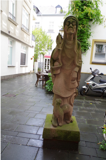
Steinfigur "Das Pfefferminzje" aus der Serie der Koblenzer Originale in der Mehlgasse in der Koblenzer Altstadt (2014)