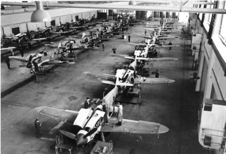
Historische Aufnahme von 1943: Produktion des von 1936 bis 1945 gebauten Jagdflugzeugs Messerschmitt Bf 109 bzw. Me 109, welches unter anderem auf dem Flugplatz Ostheim in Köln-Merheim zum Einsatz kam.