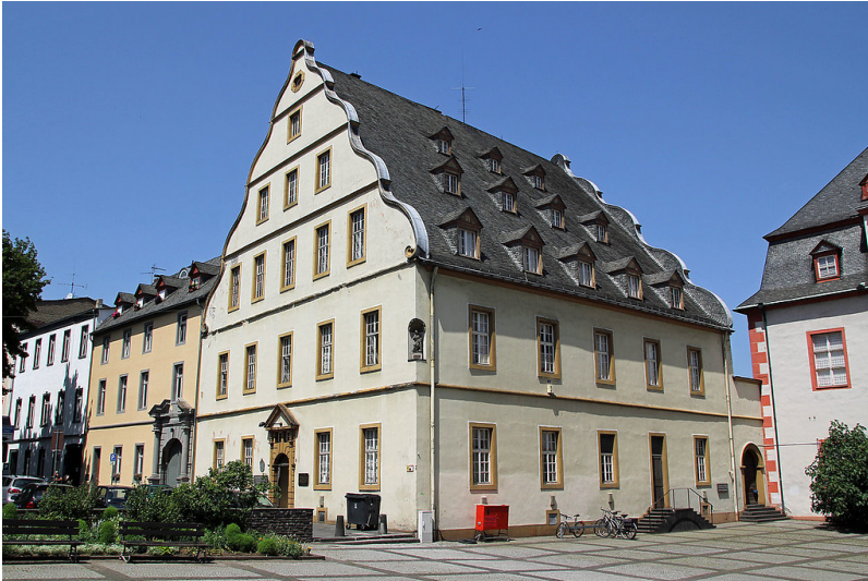
Der Büresheimer Hof in Koblenz (2011), im Jahr 1851 als neue Synagoge eingeweiht und 1938 verwüstet.