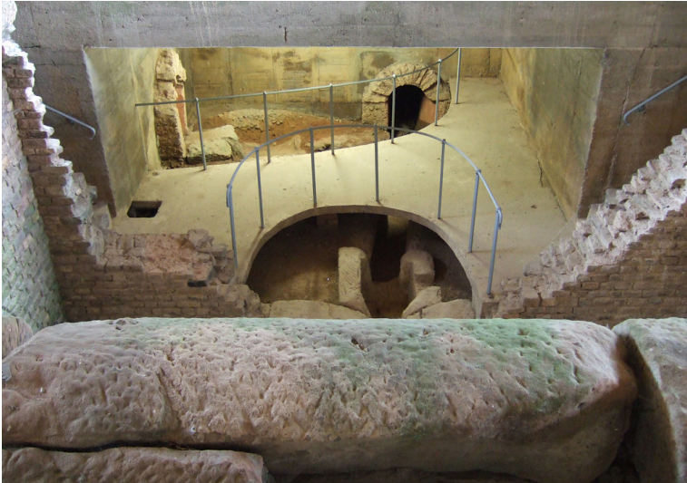
Brunnenstube Klausbrunnen in Mechernich-Kallmuth (2013)

Fachsicht(en): Kulturlandschaftspflege, Archäologie