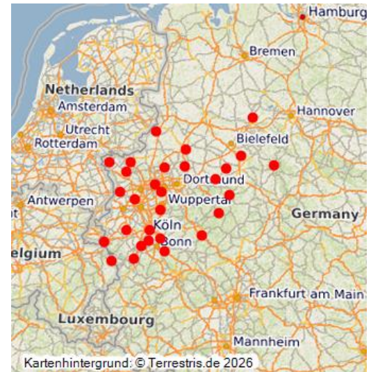
Karte der landesbedeutsamen Kulturlandschaftsbereiche in Nordrhein-Westfalen (2006).

Im Rahmen des Gutachtens der Landschaftsverbände Rheinland und Westfalen-Lippe zur Fortschreibung des Landesentwicklungsplanes Nordrhein-Westfalen wurden im Jahr 2007 für das Land NRW 29 Landesbedeutsame Kulturlandschaftsbereiche abgegrenzt und beschrieben.