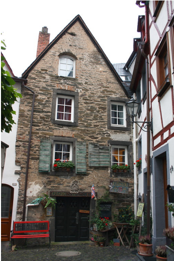
Vorderansicht der ehemaligen Beilsteiner Synagoge in der Weingasse 13 (2012)