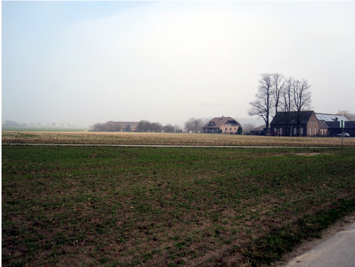
Scholtenhof in Uedem-Uedemerfeld umgeben von Landwirtschaftsflächen (2011)