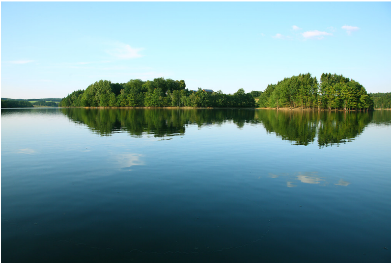
Blick auf die von Wald umgebene Wasserfläche der Bevertalsperre (2008)