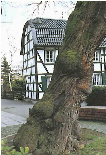
Der wulstige Stamm der Winterlinde in Rheinbach-Oberdrees mit seinen für diese Lindenart typischen knollenartigen Verdickungen (Aufnahme vor 1991).