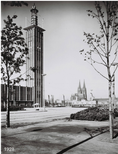
Historische Aufnahme von 1928: Der 80 Meter hohe Messeturm wurde zur internationalen Presseausstellung "Pressa" erbaut und später zu einem Wahrzeichen Kölns.

Fachsicht(en): Kulturlandschaftspflege, Landeskunde