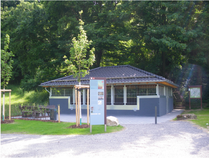
Der frisch renovierte Schutzbau der Brunnenstube "Klausbrunnen" der römischen Eifel-Wasserleitung in Mechnich-Kallmuth (2013).