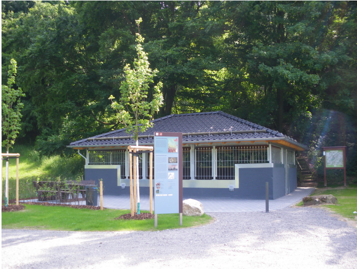
Der frisch renovierte Schutzbau der Brunnenstube "Klausbrunnen" der römischen Eifel-Wasserleitung in Mechnich-Kallmuth (2013).