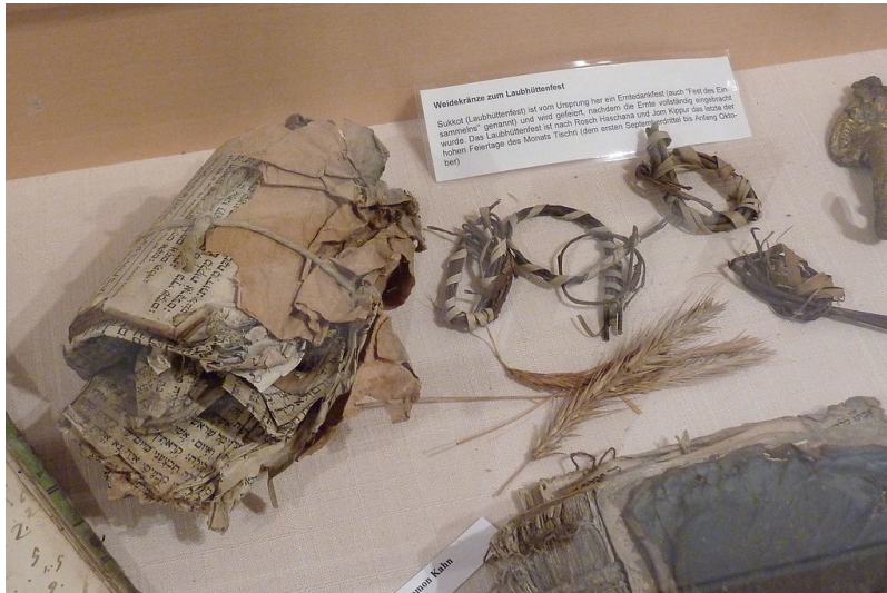
Ein Teil des bei der Renovierung der Synagoge von Niederzissen im Jahr 2011 gemachten Genisa-Funds (2012): Weidenkränze für das jüdische Laubhüttenfest ("Sukkot").

Fachsicht(en): Kulturlandschaftspflege, Landeskunde