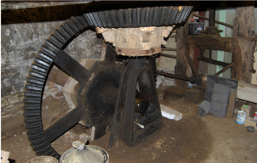
Obernühle am Glaadtbach (2012)

Fachsicht(en): Kulturlandschaftspflege, Archäologie