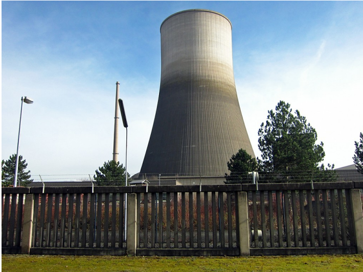
Der 162 Meter hohe Kühlturm des 1986-1988 betriebenen Kernkraftwerks Mülheim-Kärlich im Neuwieder Becken am Rhein, Ansicht aus westlicher Richtung (2015)

Fachsicht(en): Kulturlandschaftspflege , Landeskunde