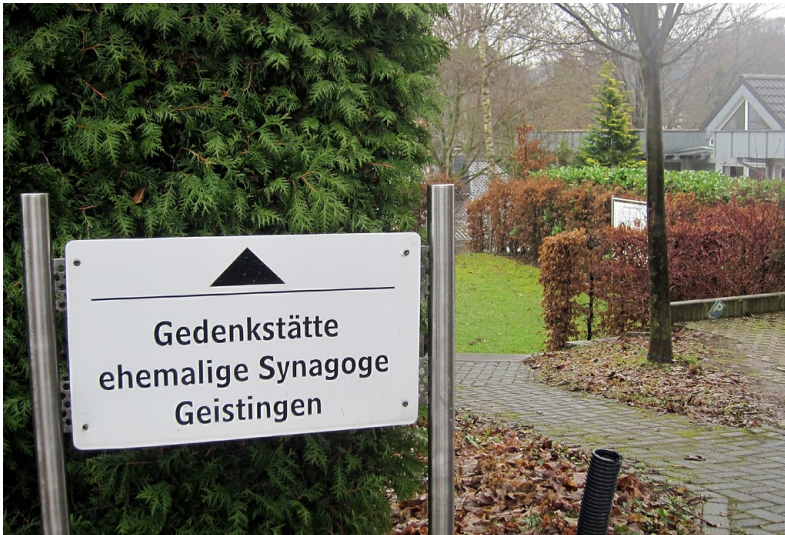
Gedenkstätte ehemalige Synagoge Hennef-Geistingen (2013)