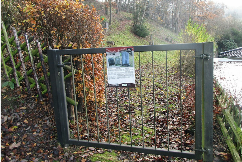
Jüdischer Friedhof am Ruppenberg in Schleiden, Zugangspforte (2016)