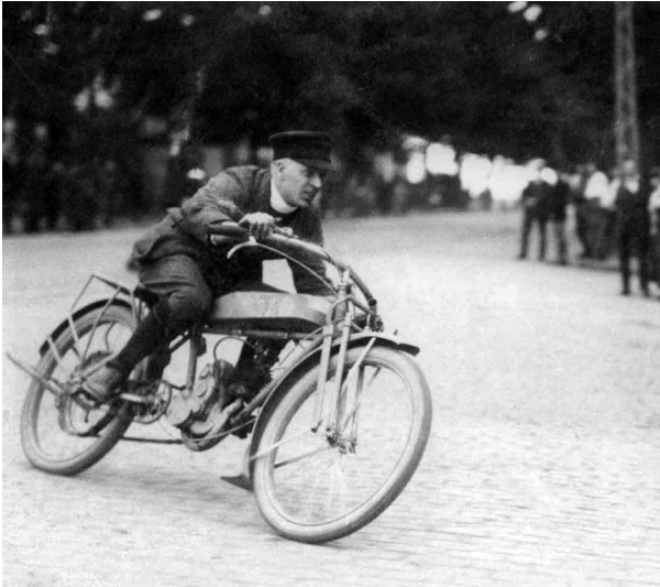
Historische Aufnahme des Rennfahrers Wilhelm Etzbach auf einer "Herko"-Rennmaschine bei einem Motorradrennen im Köln-Lindenthaler Stadtwald 1924.

Fachsicht(en): Kulturlandschaftspflege, Landeskunde