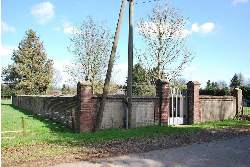
Jüdischer Friedhof Donatusstraße in Pesch, Außenansicht (2012)