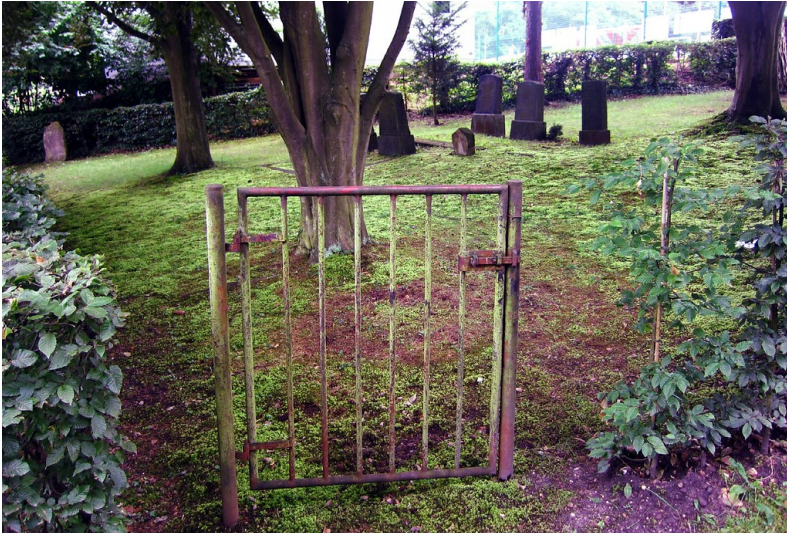
Die "verschlossene" Eingangspforte zum Judenfriedhof Matthias-Claudius-Weg in Bornheim-Walberberg (2013)