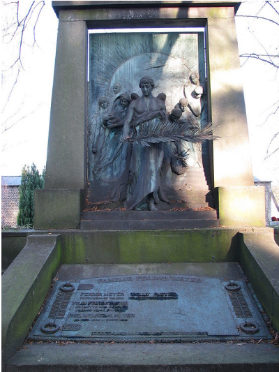
Grabmal "Die Trauer" auf dem jüdischen Friedhof an der Lütticher Straße in Aachen (2008).

Fachsicht(en): Kulturlandschaftspflege, Landeskunde