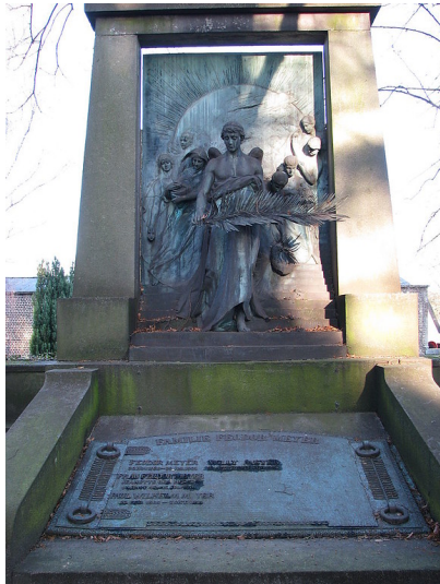
Grabmal "Die Trauer" auf dem jüdischen Friedhof an der Lütticher Straße in Aachen (2008).

Fachsicht(en): Kulturlandschaftspflege, Landeskunde