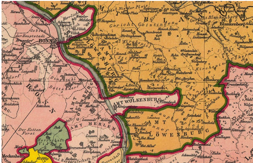
Ausschnitt aus der "Karte der politischen und administrativen Einteilung der der heutigen preussischen Rheinprovinz für das Jahr 1789" (Geschichtlicher Atlas der Rheinprovinz, 1894).