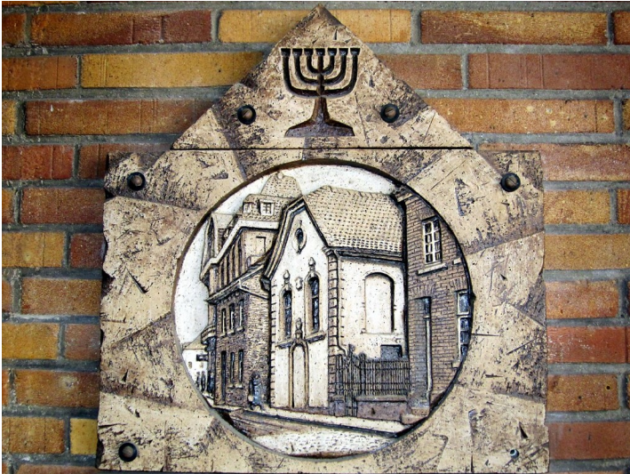
Ansicht der ehemaligen Synagoge Ratingen auf einer Gedenktafel in der Bechemer Straße (2011)