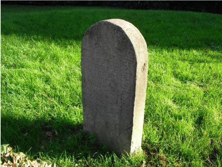
Der einzige noch vorhandene Grabstein auf dem alten jüdischen Friedhof Arnoldsweiler Straße in Düren (2010).