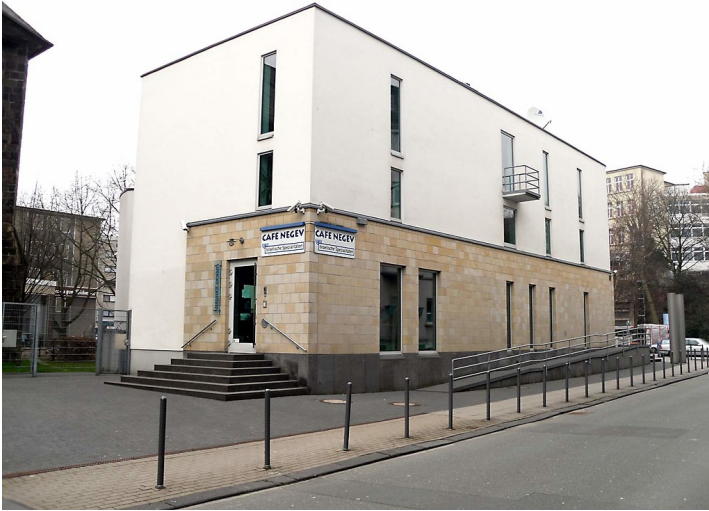
Die neue Bergische Synagoge in Wuppertal-Barmen (2011).