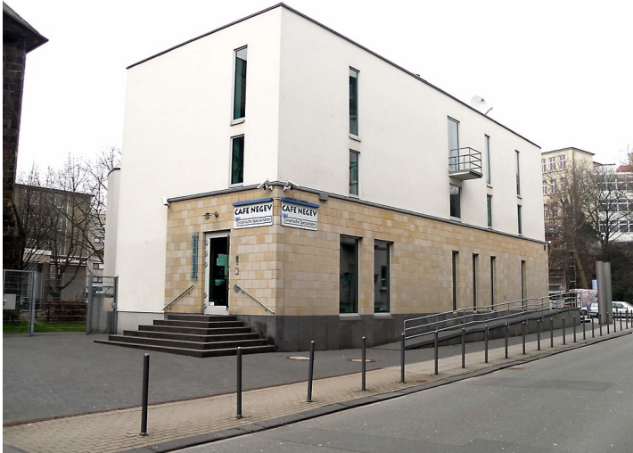
Die neue Bergische Synagoge in Wuppertal-Barmen (2011).