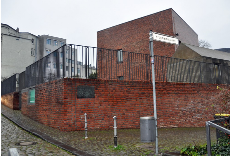
Die Begegnungsstätte "Alte Synagoge" am früheren Standort der Synagoge Elberfeld (2014).