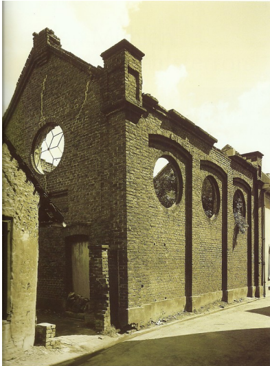
Historische Aufnahme der Ruine der Synagoge in Nettetal-Kaldenkirchen (1957).