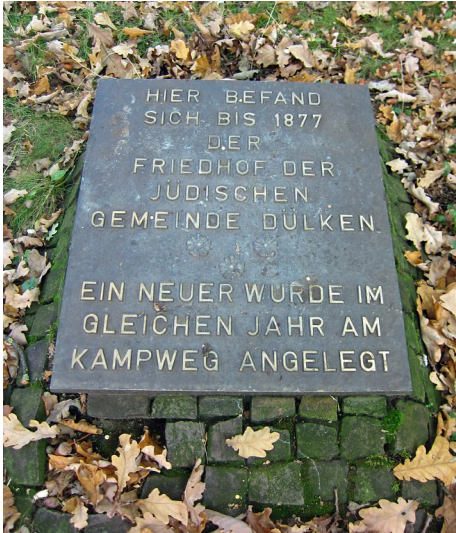
Hinweistafel auf dem Alten Judenfriedhof Venloer Straße in Viersen-Dülken (2013).

Fachsicht(en): Kulturlandschaftspflege, Landeskunde