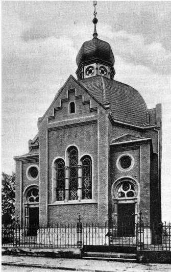
Die Beueler Synagoge 1903 (aus einer Beueler Chronik). Fotograf/Urheber: unbekannt