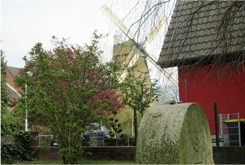
Blick vom Jüdischen Friedhof in Stommeln auf die Stommeler Mühle im Hintergrund (2012)