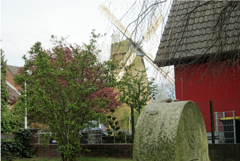
Blick vom Jüdischen Friedhof in Stommeln auf die Stommeler Mühle im Hintergrund (2012)