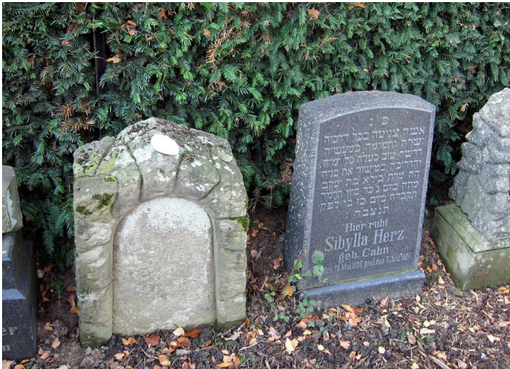
Grabsteine vom ehemaligen Dinslakener Judenfriedhof "auf dem Doelen", die sich heute auf dem Jüdischen Friedhof auf dem Parkfriedhof, Willy-Brandt-Straße, befinden (2011)