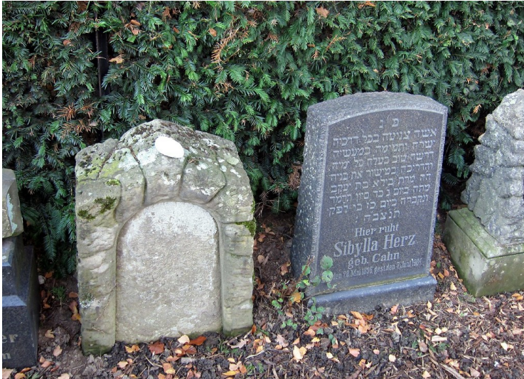
Grabsteine vom ehemaligen Dinslakener Judenfriedhof "auf dem Doelen", die sich heute auf dem Jüdischen Friedhof auf dem Parkfriedhof, Willy-Brandt-Straße, befinden (2011)